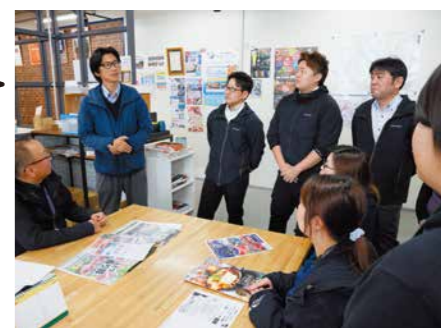
毎日の朝礼は先輩後輩入り交じってフランクな雰囲気印象的だった。