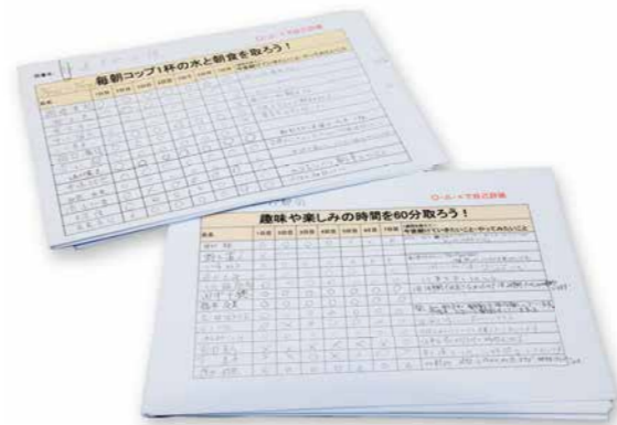
1週間チャレンジの結果記入シート。目標には「入浴前にコップ1杯の水を」など数字を盛り込んだ。

社長、担当者、生命保険会社でチームを結成。アンケートで社員の健康状況を把握し、浮かび上がった課題を履行しやすい目標にして提示した。その目標に全社員参加で取り組む「1週間チャレンジ」を実施。毎日の結果をX△Oで記したシートを会社に提出するという一方通行にならない方法とした。注目したいのは「結果は求めない」という上層部の姿勢だ。「Xが続いてもいい」と割り切り、健康意識の継続を重視した。これがじわじわと社員の心に広がっていった。